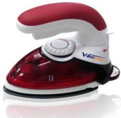
Mini ferro de passar p/viagem Preço médio: R$ 99,90