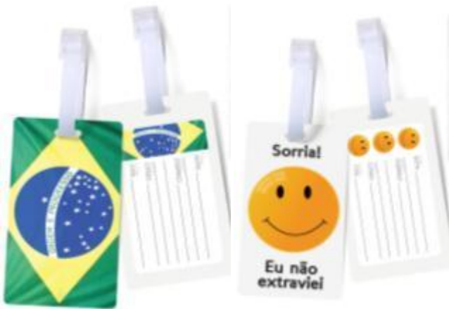
Identificador de bagagem Preço médio: R$ 14,90

Identificar a bagagem com os dados pessoais é sempre importante. Nas lojas da rede é possível encontrar diversos modelos divertidos e que combinam com o destino. Para as roupas, que podem chegar amassadas devido ao armazenamento na mala, o ferro a vapor é compacto e possui apenas 16cm.