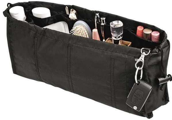
Organizador bolsa Preço médio: R$ 39,90

Organizadores são sempre bem-vindos quando o assunto é viagem. O porta sutiã preserva as peças sem amassar os bojos. Já o organizador de bolsa é prático, útil e funcional, pois apresenta compartimentos que deixam tudo organizado.