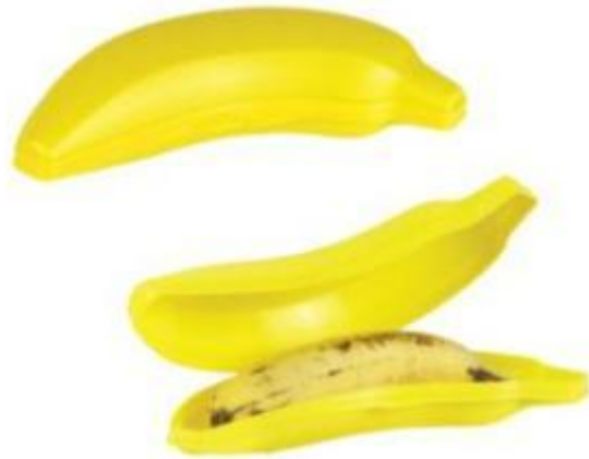
Porta banana Preço médio: R$ 7,90

Cuidar da alimentação também é essencial em viagens mais longas. A bolsa térmica de 18L é confeccionada em laminado de pvc para manter a temperatura dos alimentos por mais tempo. Já o porta banana evita que a fruta fique amassada.