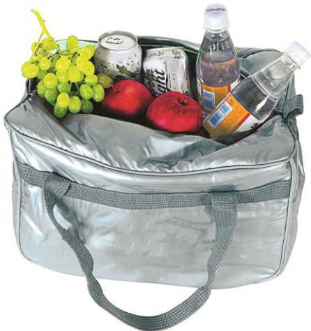
Bolsa térmica Preço médio: R$ 59,90

Organizadores são sempre bem-vindos quando o assunto é viagem. O porta sutiã preserva as peças sem amassar os bojos. Já o organizador de bolsa é prático, útil e funcional, pois apresenta compartimentos que deixam tudo organizado.